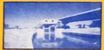
A Comporta do Grand Derby Tocantina também foi construída com o dinheiro do seu IPTU